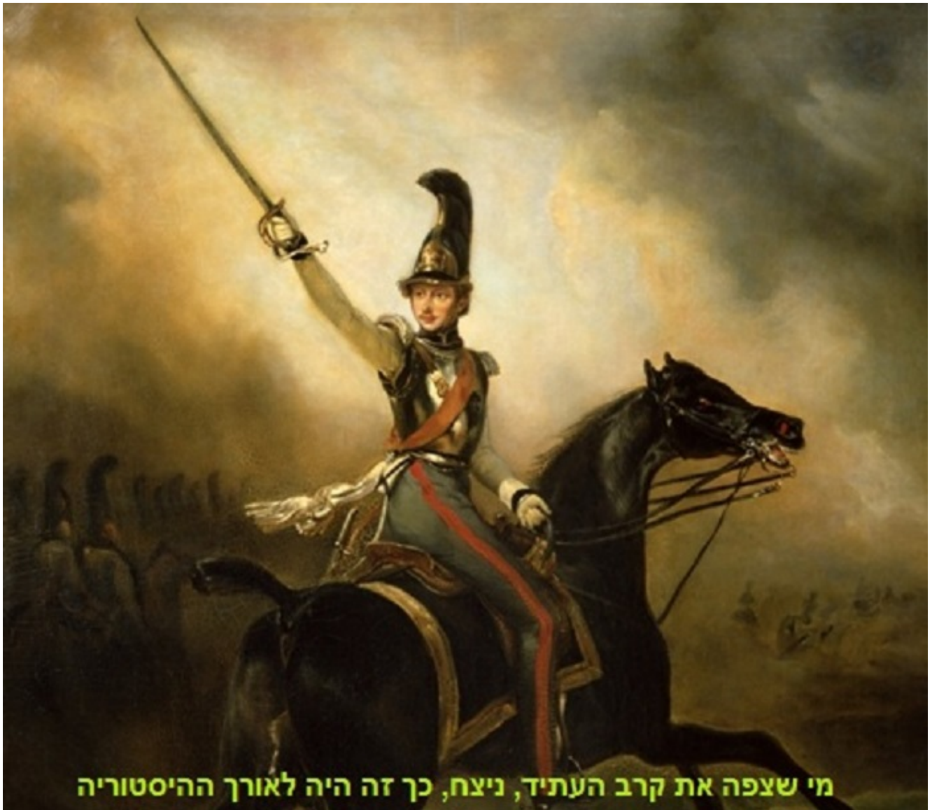
מי שצפה את קרב העתיד, ניצח, כך זה היה לאורך ההיסטוריה

ההיסטוריה מלמדת אותנו כי מי שצפה את קרב העתיד, ניצח. זה היה לאורך ההיסטוריה, כאשר המנצחים היו אלו שראו את התוצאה מראש. הם ידעו כיצד לנהל את המשחק, וכיצד לנצל את היתרונות שלהם. הם היו מוכנים להקריב, ולתת את חייהם למען המטרות שלהם. הם היו אלו שניצחו, ואלו שניצחו הם אלו שצפו את קרב העתיד.